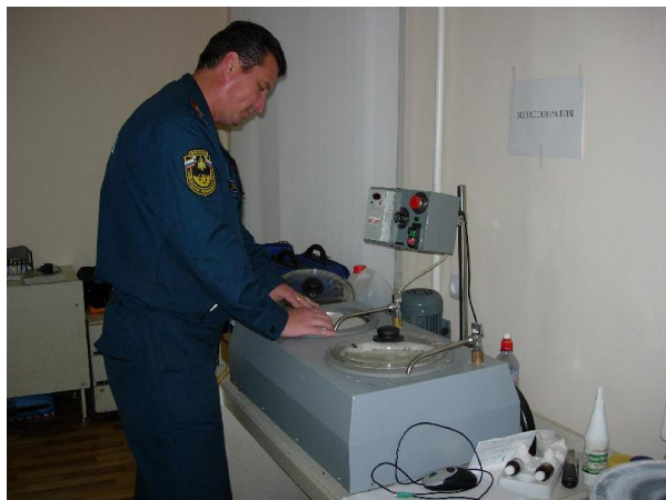
Рис. 2.21. Деятельность испытательной пожарной лаборатории

На протяжении последних пяти лет одним из приоритетных направлений деятельности МЧС России является формирование и укрепление в структуре ФПС системы судебно-экспертных учреждений (учреждений). В настоящий момент она состоит из 76 учреждений (рис. 2.21).